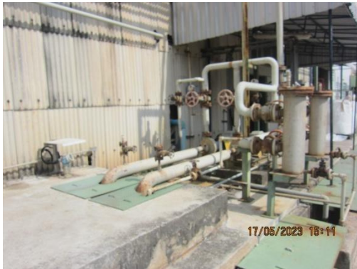
รูปที่ 7 บ่อตรวจสอบคุณภาพน้ำเสียของโรงงาน