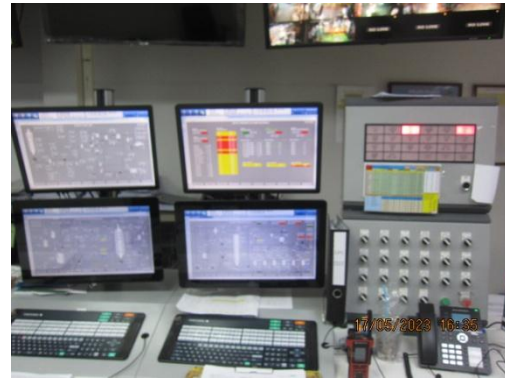
รูปที่ 36 ระบบควบคุมอัตโนมัติ