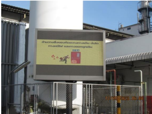
รูปที่ 35 ช่องทางการสื่อสารด้านความปลอดภัย