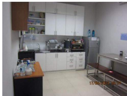
รูปที่ 12 ห้องพักพนักงาน

ภาพถ่ายประกอบผลการปฏิบัติตามมาตรการป้องกันและแก้ไขผลกระทบสิ่งแวดล้อม