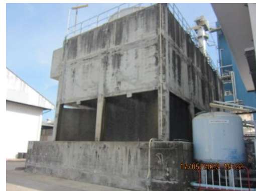
รูปที่ 6 Cooling Tower

ภาพถ่ายประกอบผลการปฏิบัติตามมาตรการป้องกันและแก้ไขผลกระทบสิ่งแวดล้อม