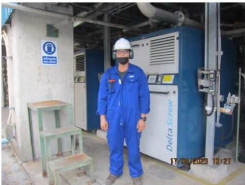
รูปที่ 11 พนักงานสวมใส่อุปกรณ์ป้องกันเสียง