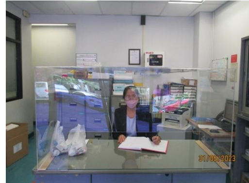
รูปที่ 30 พยาบาลประจำห้องพยาบาล