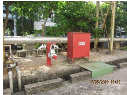
รูปที่ 24 Hose Box และหัวจ่ายน้ำดับเพลิง