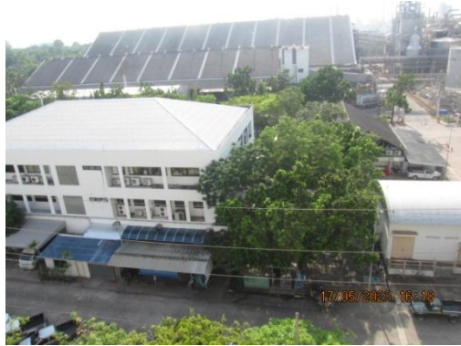
รูปที่ 39 รูปแบบอาคารสิ่งก่อสร้าง ที่ไม่ทำลายทัศนียภาพและสิ่งแวดล้อม