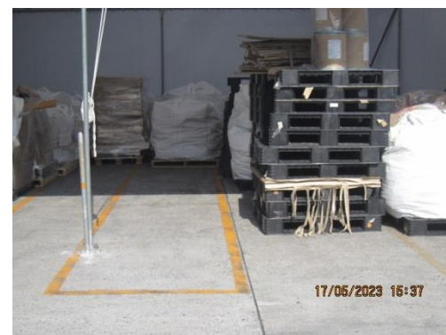
รูปที่ 16 การแบ่งพื้นที่ระหว่างมูลฝอยและสิ่งปฏิกูลหรือวัสดุที่ไม่ใช้แล้ว