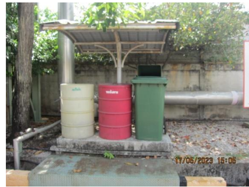
รูปที่ 14 ถังขยะแยกประเภทที่มีฝาปิดมิดชิด