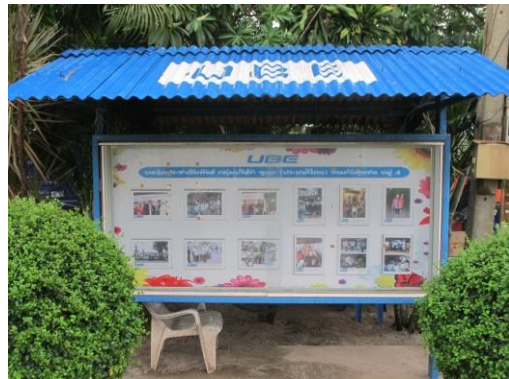
รูปที่ 40 บอร์ดแสดงผลการติดตามตรวจสอบ คุณภาพสิ่งแวดล้อม

ภาพถ่ายประกอบผลการปฏิบัติตามมาตรการป้องกันและแก้ไขผลกระทบสิ่งแวดล้อม