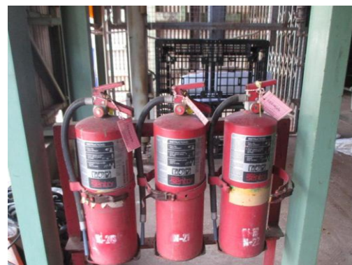
รูปที่ 26 ถังดับเพลิง