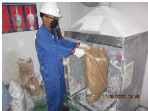
รูปที่ 33 พนักงานสวมใส่อุปกรณ์คุ้มครองความปลอดภัยส่วนบุคคลขณะเติมสารเคมี