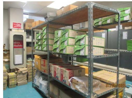
รูปที่ 34 อุปกรณ์คุ้มครองความปลอดภัยส่วนบุคคล

ภาพถ่ายประกอบผลการปฏิบัติตามมาตรการป้องกันและแก้ไขผลกระทบสิ่งแวดล้อม