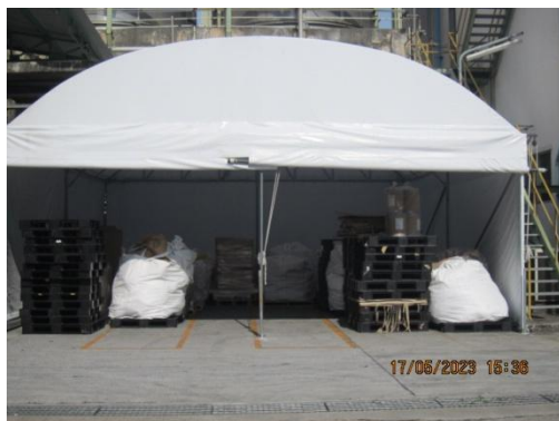
รูปที่ 15 อาคารเก็บกากของเสียรอกำจัด