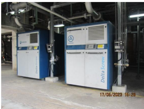
รูปที่ 9 อุปกรณ์ลดระดับเสียงที่แหล่งกำเนิด