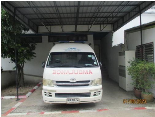
รูปที่ 31 รถพยาบาล