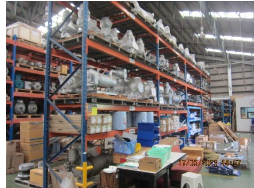
รูปที่ 2 ะไหล่สำรอง อุปกรณ์ซ่อมบำรุง สำหรับบำบัดมลพิษทางอากาศ