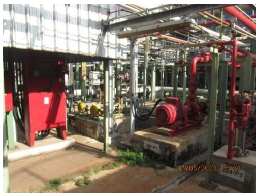
รูปที่ 25 ระบบท่อส่งน้ำดับเพลิง