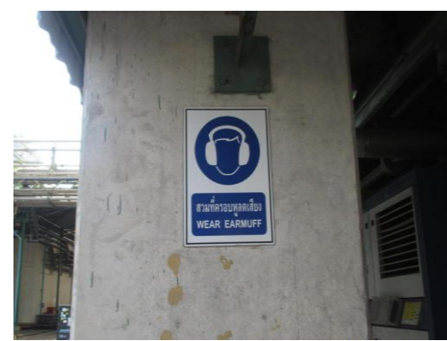
รูปที่ 10 ป้ายเตือนให้สวมใส่อุปกรณ์ป้องกันเสียง