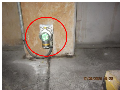
รูปที่ 27 Flammable Gas Detector