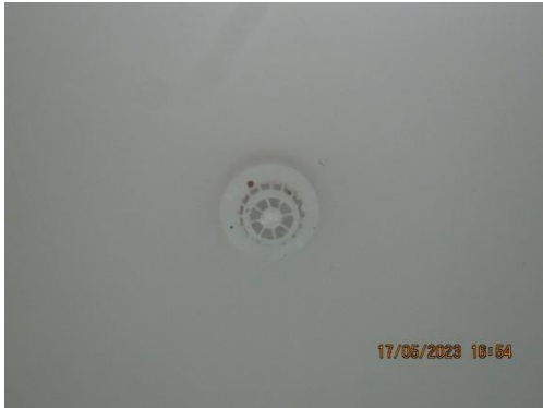
รูปที่ 29 Smoke Detector