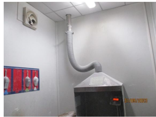
รูปที่ 32 พัดลมดูด AH Salt ออกนอกอาคารผลิต