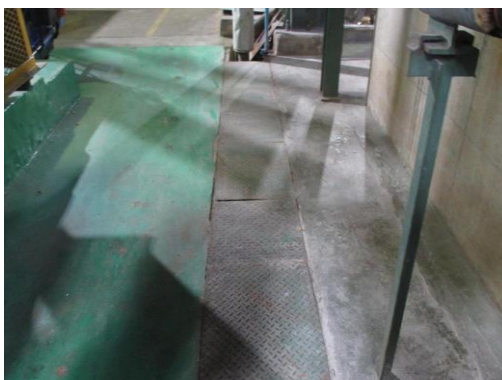
รูปที่ 5 รางระบายน้ำเสีย