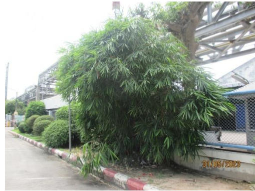
รูปที่ 38 พื้นที่สีเขียวภายในโรงงาน (ต่อ)