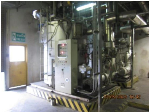
รูปที่ 1 Hot Oil Heater