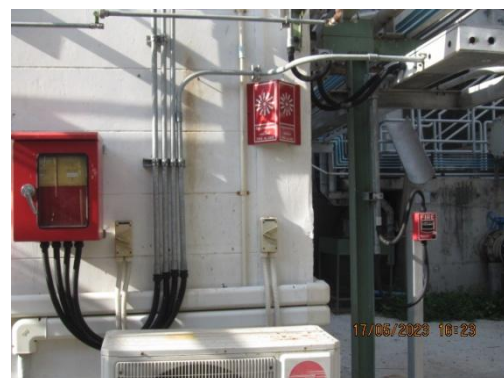
รูปที่ 28 Manual Call Point

ภาพถ่ายประกอบผลการปฏิบัติตามมาตรการป้องกันและแก้ไขผลกระทบสิ่งแวดล้อม