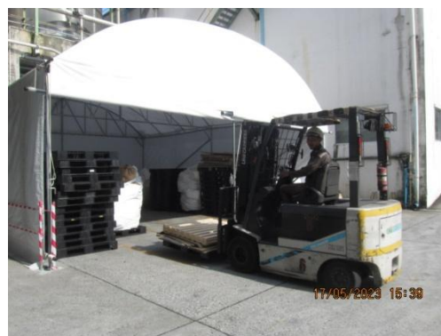
รูปที่ 17 พนักงานควบคุมและดูแลการจัดเก็บและเคลื่อนย้ายของเสีย

ภาพถ่ายประกอบผลการปฏิบัติตามมาตรการป้องกันและแก้ไขผลกระทบสิ่งแวดล้อม