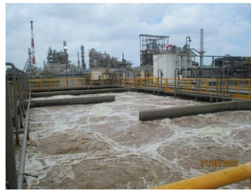
รูปที่ 8 ระบบบำบัดน้ำเสียของ โรงงานผลิตสารคาโปรแลคตัม