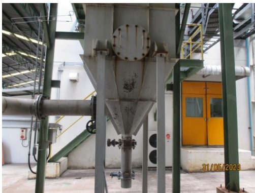
รูปที่ 3 Bag Filter ในระบบดําเลียงเม็ดในลอน