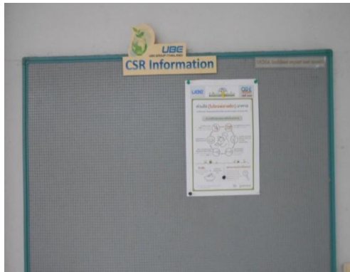
รูปที่ 13 บอร์ดประชาสัมพันธ์ และช่องทางการสื่อสารด้านความปลอดภัย