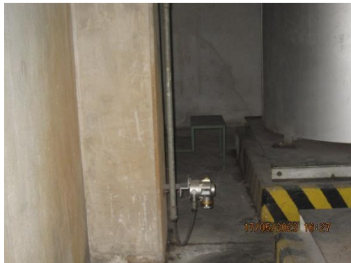
รูปที่ 23 Gas Detector