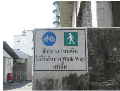
รูปที่ 18 ป้ายจราจรและป้ายจำกัดความเร็วภายในโรงงาน