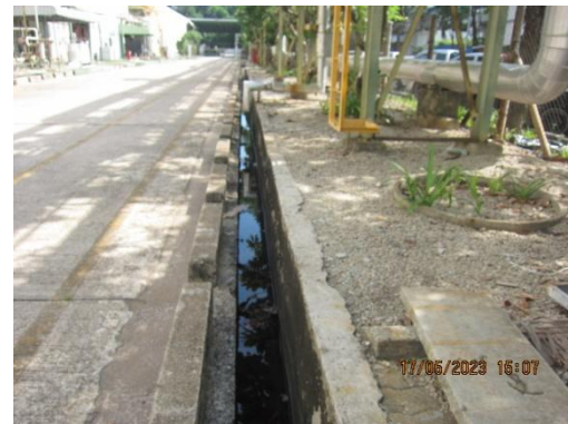
รูปที่ 4 รางระบายน้ำฝน